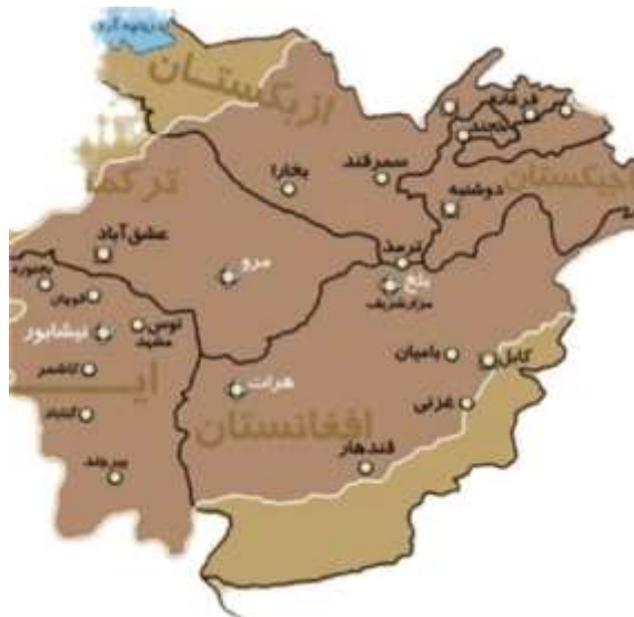
نقشه خراسان قدیم.

هموطنان عزیز بحضور شما عرض میدارم که امریکا، و بریتانیا هر دو مربیان طالبان و داعش برای پیشبرد اهداف خاص شان در خراسان قدیم که عبارت از قسمتهای کشورهای آسیایی مرکزی، جمهوری اسلامی ایران و افغانستان اند میباشند، و این کشورها نه تنها از منابع سرشاری زیر زمینی مخصوصاً پترول و گاز طبیعی برخوردار اند بلکه کشورهای روسیه و چین که در همسایگی خراسان قدیم قرار دارند نیز از نگاه جوپولتیکی برای امریکا و بریتانیا قابل اهمیت خاص اند.