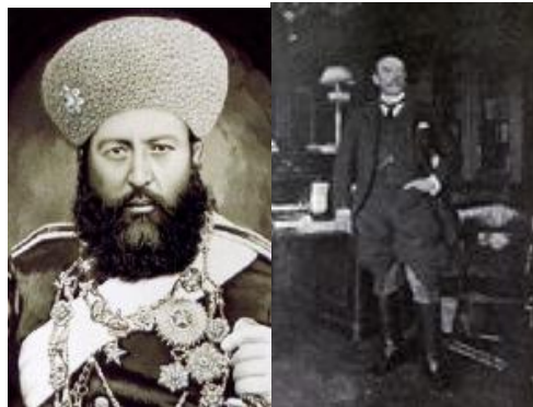
سر هنری مورتیمر دیورند

من که صلاحیت تثبیت انرا بدون اسناد معتبر نداشتم به AI که فعلاً یک مرجع بی طرف و دسترسی به آرشیفهای بین المللی دارد مراجعه و مطالب معلومات موثق در باره موادات معاهده اصلی و سند نشر شده گردیدم که اینک در ذیل معلومات ارایه شده AI را بدون کم کاست خدمت هموطنان تقدیم میدارم .