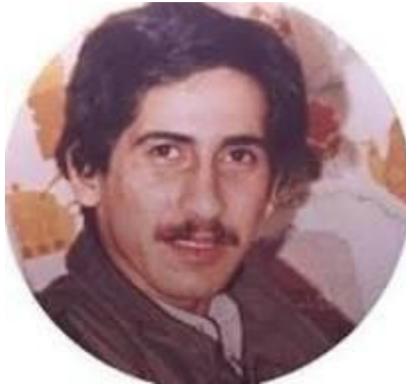
(د لومړي وزير ذوالفقار علي بوټو كشر زوی شاه نواز بوټو)

پنجابی پوځ: جوړښت، شاليد او کودتاکانی (۷)