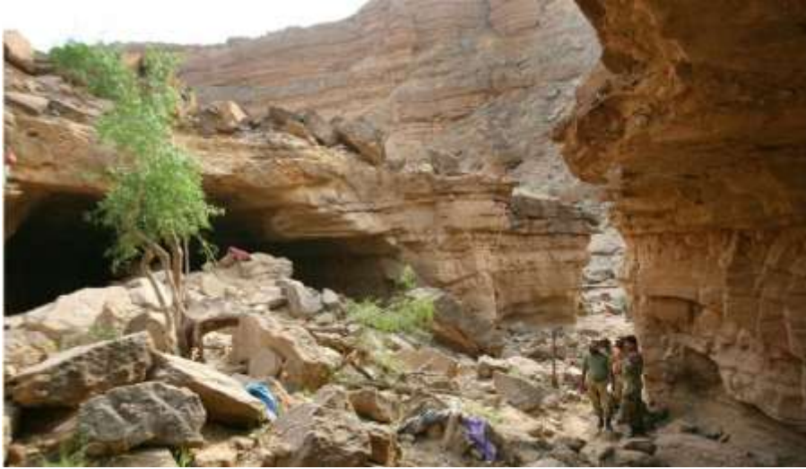
هغه سمخه چې اکبر خان بگتي او ملگري يې په کې شهيدان شول. (bbc.com/urdu)

جنرال مشرف په دې اند ؤ چې نړۍ والو او د بلوڅانو نورو قومونو ته اکبر خان بگتي يو ترهگر او ناوړه کس وروپېژني خو د اکبر خان وژل د مشرف د هيلي خلاف، داسې څه وو چې له اکبر خان څخه يې شهيد او يو اتل جوړ کړ او مشرف يو قاتل او دولتي ترهگر وبلل شو چې دا دواړه به په تاريخ کې ثبت شي. په دې اړه د پاکستان وتلي ورځپاڼه ليکونکی احمد رشيد ليکي: «د نواب اکبر بگتي وژل کيدل او هغه لاره چې نوموړي په خپل ژوند کې غوره کړې وه، هغه د پاکستان د بلوڅ ملتپالو لپاره په يو (شهيد او اتل) بدل شوی دی. دا د هغه انځور خلاف دی چې اسلام آباد غواړي له پناغلي بگتي څخه يې وړاندې کړي او هغه د دولت ضد ياغي او يو وروسته پاتې قبایلي مشر وبولي، د سردار نواب اکبر بگتي په وژلو سره، ولسمشر پروېز مشرف اوس له يوې تلپاتې دښمنۍ سره مخ شوی دی، نه يوازې د بلوڅو د ياغيانو له لوري، بلکې د هغو بلوڅانو له خوا هم چې له پوځ سره جگړه نه کوي خو لا هم د خپل ايالت د نه پرمختگ له امله له اسلام آباد حکومت څخه خوابدي دي.» 12