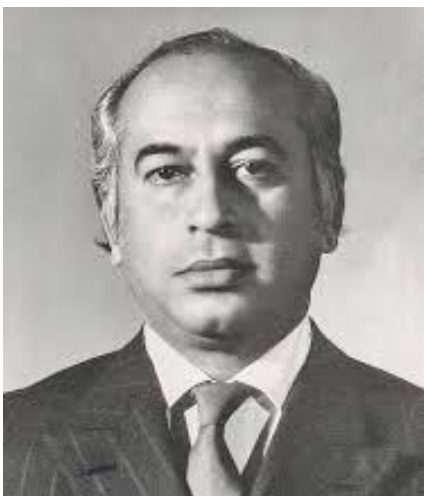
(لومړی وزير ذوالفقار علي بوټو) 4

پر مهال، جنرال ضياء په اردن کې د پاکستانی پوځ د پوځي سلاکارانو مشري کوله چې د فلسطيني سرتېرو پر وړاندې يې اردنی پوځ په ښه توگه وکاراوه چې د دغو خدمتونو پر وياړ، جنرال ضياء ته د اردن پاچا له خوا، د اردن تر ټولو لوړ پوځي نښان (مدال) ورکړل شو. د تور سپتمبر له عملياتو وروسته، جنرال ضياء، د اسراييلي صهيونستي رژيم لپاره ډېر په زړه پورې کس وگرځيد. 3