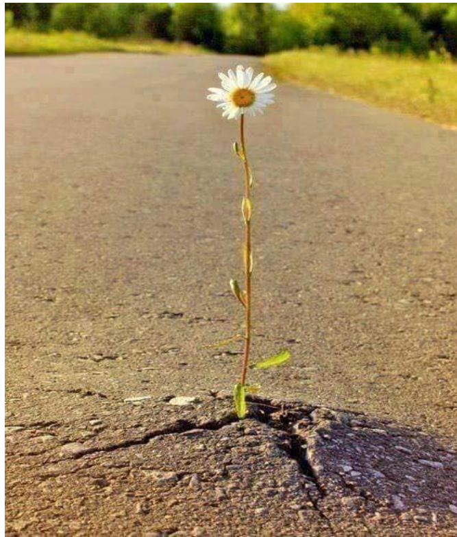
د دریمې برخې پای

اباد کړی په وجود کی چا د شگو بیابان دی چې دریاب ته په یوه لپه اوبو پسي روان دی مات خوبونه زه په ماتو، ماتو سترگو باندې گورم تري خاڅکي راورپري، د پنځم موسم باران دی ماته وايي چې کافر یی، تر چری لاندې یی پروت یم راته کړی په غوړونو کی چې کوم ملا آذان دی تپر می نه شي چیرته ستوري، زه پر دی باندې وپرېږم د اوبو په ډک گیلان کی می لیدلی نن اسمان دی زه د خپل وجود په تاو کی لکه ونه سوخېدمه زما سیوری په بل چا و، مگر لمر می په خپل ځان دی چا تر پینو لاندې باقهره، و میږی چیرته مړ کړی لا تر اوسه می رنگ زیر دی، لا تر اوسه می زړه وران دی