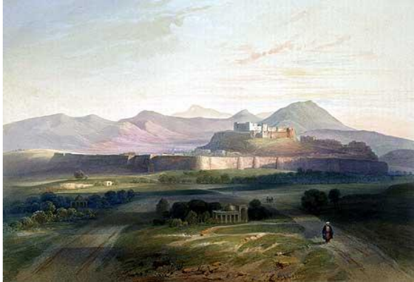
د غزني ښار په ۱۸۸۳ ميلادي كال ( د افغان انگرېز د جگړې پرمهال )

اوس چې له نيکه مرغه د اسياسكو اسلامي سازمان د غزني ښار ته په ۲۰۱۳ ميلادي كال كې د اسلامي كلتوري مركز د لقب وركولو پريكره كړېده، ټولي هغه اړيني چاري چې د دې لقب د پرځای كولو او ساتلو لپاره شته، بايد په پوره ځيركۍ او وړتيا تر سره شي. په دې ترڅ كې غواړم د خپلې هغه ليكنې څخه د وړانديزونو لړۍ د لاسوهني پرته را واخلم چې دوه كاله وړاندي مي د (( م لرغونۍ غزني او د هغه ځانگړي تاريخي وياړونه )) تر سر ليك لاندې ليكلي وه .