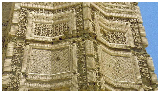
په غزني د یوه نامتو منار دوه انځورونه

د نامتو زیارتونو او د سیاسي سترواکانو او واکمنانو پر هدیرو او د غزنوي سترواکۍ پرمهال د جوړو شویو ودانیو پر بیلا بیلو خوا د اسلامي لیکدود او بیلا بیلو لیکنیو شتون د زیارتونو او مقبرو ارزښت لا زیات کړی دی . د غزنویانو د سترواکۍ پرمهال لږ تر لږه د لیکدود شیر ډولونه لکه مناشیر ، محقق ، نسخ ، ریحان ، رقاع او ثلث هم د کتابونو د لیکلو پرمهال او هم د زیارتونو د لوحو او ډبرلیکونو لپاره کارول شوي دي ، یو شمیر داسې لیکنیز لاسوندونه هم شته او دا ثابتوي چې د غزنویانو د سترواکۍ پر مهال بیلابیل ښکلي تصویرونه او انځورونه هم د ځینو مینه والو له لوري کارول شوي دي ، او له هغې ډلې یو هم د سلطان محمود زوي سلطان مسعود وو چې په هرات کې یې د خپل کور د ښکلا لپاره انځورونه خوښ کړي او کارولي وه . دا کور د عدناني باغ په نوم یاد شوی دی . د بیهقي په حواله د همدې انځورونو له امله د سلطان محمود له خوا تنبه شو . ( تاریخ خط و نوشته های کهن : ۱۰۵ )