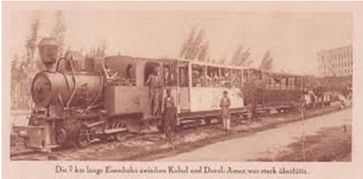
Die 7 km lange Eisenbahn zwischen Kabul und Dorul-Aman war stark überfüllt.