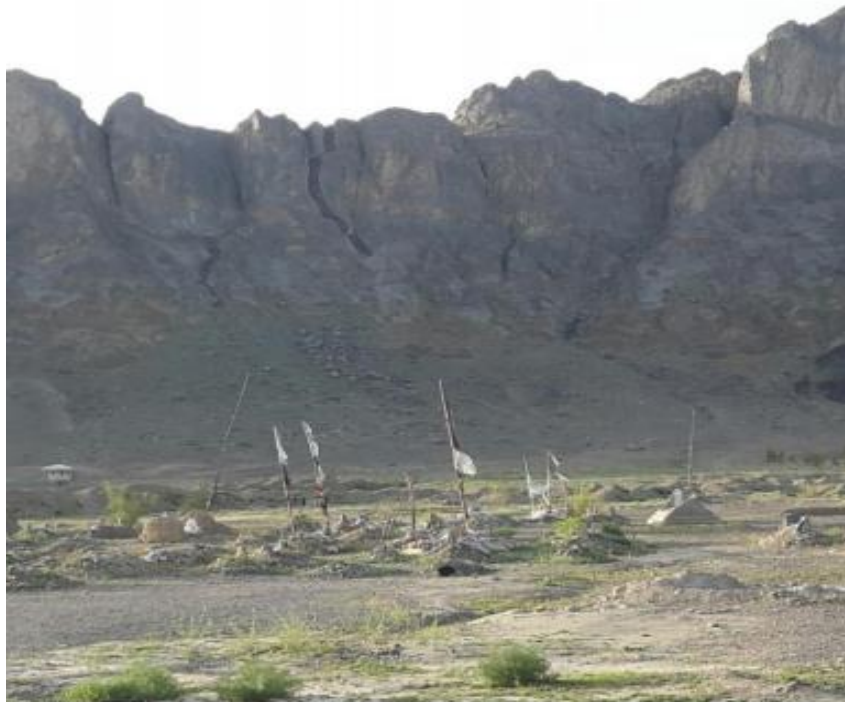
د مار غر - د مار انځور د توري ډبري په شان پکښې څرگند دی

هغه وخت د پنجوايي بازار فقط يو څو محدود خټين دوکانونه درلودل. خو اوس چي مور وکتل د يوې ښاري سيمي په شان غټ او کوچني دوکانونه پکښي اباد سوي ول . ددغو دوکانو لويديځ لوري ته يو بل غر شمال او جنوب پروت دی چي د (ماسم غر) ئي بولي. ددې غره په لويديځه برخه کي څو کاله دمخه د نړيوال ائتلاف د کاناډايي عسکرو يو لوی کمپ پروت وو چي د کاناډا صدراعظم هارپر هم دغه غره ته د خپلو قطعاتو د کتنې له پاره تللی وو. په هغه وخت کي ما ددغه غره د نامه او موقعيت په باب يوه ليکنه په مېډيا کي خپره کړه چي دلته به ئي هم را نقل کړم: "