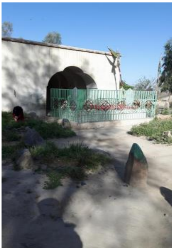
د حاجي گلون بابا زيارت