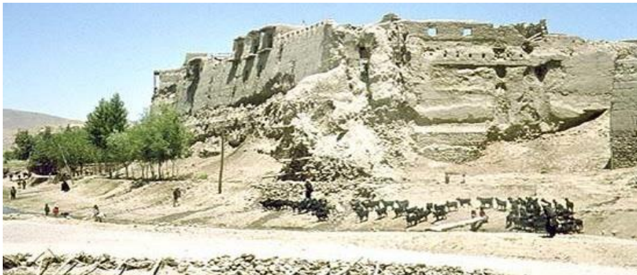
د موندیگک غونډی