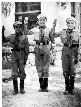
و لا محضرت شهر اده شاه محمود داخل حضرت هما بو ایز وی چوسط کهن اودنغا علی صدر را ا عظمت را من وینس او خا لنده خیرا و آنی به در ا من حالهات کنس چیر کار اده وی بو تفورم ای افغانس دی او خا را ده وی رسمه اعزام ام بو خا تگری دی