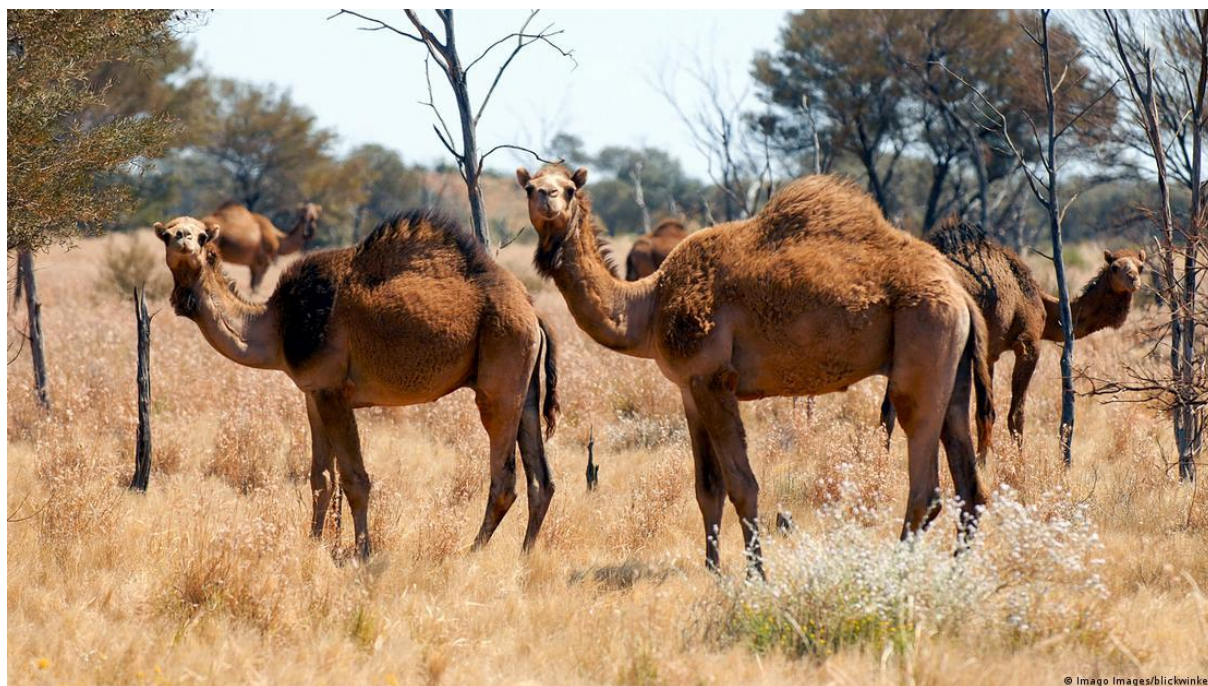
شتر های وحشتی استرالیایی

در اوایل قرن نوزدهم، برای اولین بار بود که مردمان کتواز و سلیمانخیل حدود بیست هزار نفر شتر را جهت فروش به استرالیا بردند و این شترها را غرض انتقالات در سکتور اعمار راه های آهن بالای استرالیایی ها فروختند و حتی بقول عبدالمجید زابلی همین ها بودند که در استرالیا اجاره داری انتقالات راه آهن و امور ساختمانی را عهده دار شدند کردند و خطوط آهن را بمقابل اجوره تمدید کردند. هم اکنون تعداد این شترها در استرالیا که بصورت آزاد در چراگاه ها زندگی دارند به یک میلیون میرسد.