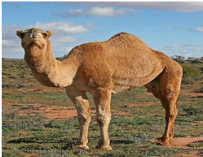
شتر یک کوهانه

شتر یک حیوان پستاندار نشخوار کننده سه معدوی بسیار نیرومند و تنومند میباشد، که همچنان در مقابل تشنگی به دلیل اینکه درجه حرارت بدن خویش بروفق درجه حرارت محیط تغیر میدهد مقاومت خارق العاده دارد و از ده تا بیست روز تحمل تشنگی و گرسنگی را دارد، زیرا این حیوان برای سردکاری بدنش از آب بدن خویش استفاده نکرده برعکس آنرا ذخیره میکند. به همین دلیل شتر را کشتی صحرا می نامند. شتر توانایی انتقال حدود تا چهارصد کیلوگرام بار را با یکدم تا فاصله های چهل تا پنجاه کیلومتر دارا میباشد. شتر ها میتوانند ۲۰۰ لیتر آب را درسه دقیقه بنوشند. شتر ها دارای گردن و پا های بسیار دراز بوده و همین امر باعث شده تا این حیوان با سرعت تا ۶۵ کیلو متر فی ساعت بدود که در کشور های شمال افریقا و کشور های عربی شتر ها در مسابقات دوش و سایر بازی های میدانی شرکت میکنند.