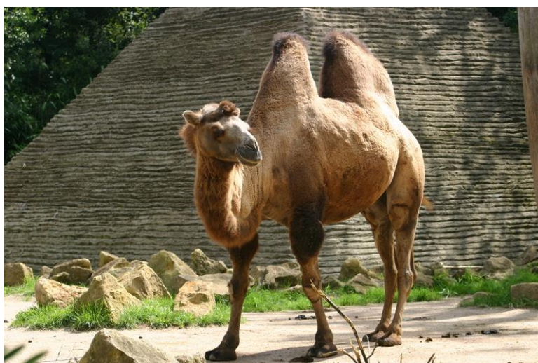
شتر دو کوهانه باختری

شتر های یک کوهانه و دو کوهانه خاستاً شتر های بلوچی در افغانستان جثه های بزرگ داشته و به همین نسبت برای تولید گوشت بسیار مفید و مؤثر میباشند. این شترها از ششصد تا هزار کیلوگرام گوشت تولید میکنند. همچنان از پوست این حیوان در صنعت بوت دوزی و از پشم آن در ساختن خیمه، شال، نمد و لباس های پشمی نهایت گرم استفاده میکنند.