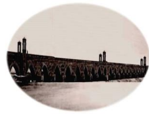
عکس قدیمی پل شکومند و تاریخی مالان