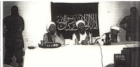
Terroristenchef bin Ladin (M.) mit Begleitern und Leibwächtern in Afghanistan: Fünf Millionen Dollar Kopfgeld ausgesetzt (« سرکرده تروریست ها "ابن لادن" (وسط) با محافظان در افغانستان: پنج میلیون دلار جایزه آوردن سر تعیین شده است. »، شینگل ۱۹۹۸/۴۶م)

پیشبینی وقوع و جلوگیری از حوادث و حملات تروریستی شبکه های اخوان المسلمین بین المللی که در بین خود باهم ارتباطات مخفی دارند کار دشوار است. قریب بیست سال اند که پر قدرترین کشورهای جهان، مصروف بزرگترین و پرمصرفترین عملیات جنگی علیه تروریسم است، مگر تروریسم بین المللی هنوز هم زنده و فعال است. با کشتن رهبران القاعده، نابودی شبکه های مخفی تروریستی القاعده و دیگر شبکه های بنیادگرایی ناممکن است. شبکه القاعده با کشتن اسامه بن لادن در 2011 میلادی در ایت آباد پاکستان "متحد" جنگ علیه تروریسم ایالات متحده امریکا و انداختن تابوت در بحر، القاعده زنده و بیشتر فعالیت دارد.