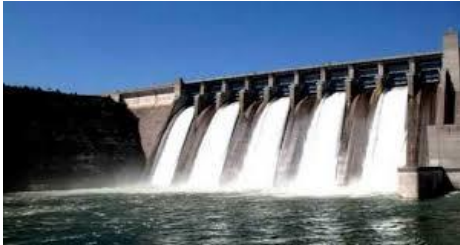
بند سلما واقع در ۱۶۰ کیلومتری شرق شهر هرات