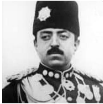
شاه امان الله