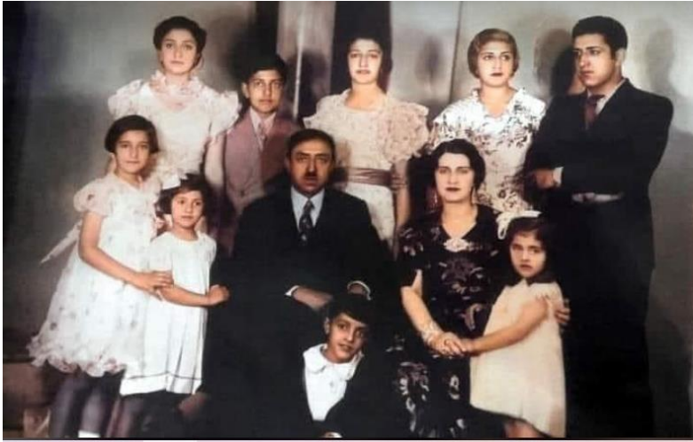
شاه امان الله و ملکه ثریا با فرزندان خود در ایتالیا