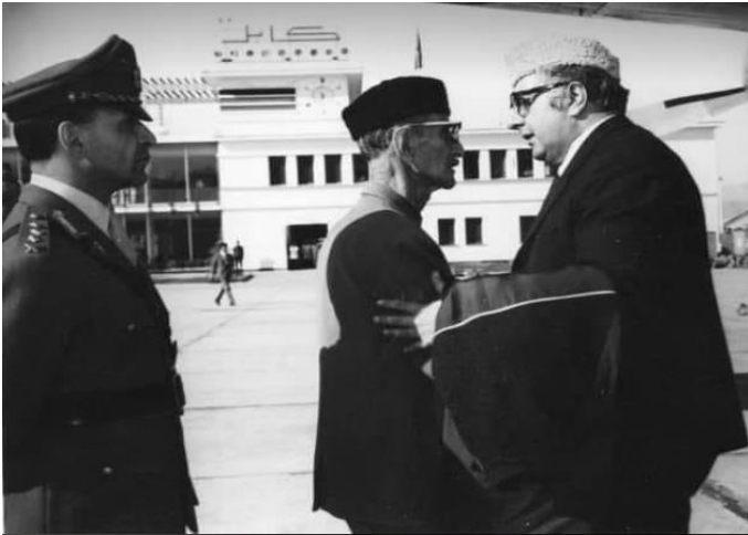
شاه ولیخان هنگام وداع با شهزاده رحمت الله دافغانستان

ومراتب اخلاص و حرمت گزاری خود را نسبت به آن شاه فقید ابراز بدارند، مگر به شهزاده رحمت الله اجازه داده نشد تا از جلو مردم کابل عبور کند و از ایشان اظهار تشکر نماید. شهزاده رحمت الله را از دروازه عقبی مسجد بیرون بردند و سردار کبیرالله سراج به میان صف مردم فرستاده شد تا از مردم تشکر کند و بگوید که او از دروازه عقبی مسجد خارج شده است. سردار کبیرالله سراج علاوه نمود که در همان روز سوم فاتحه به پسر مرحوم شاه امان الله گفته شد هر چه زودتر کشور را ترک بگوید، ولی او خواهش نمود که فقط یک روز دیگر به وی اجازه داده شود تا یک بار قصر دارالامان و باغ پغمان را که پدرش از این دومحل زیاد یاد مینموده از نزدیک ببیند، مگر دستگاه سلطنت از قبول این خواست انسانی وی امتناع ورزید و شهزاده با خواهر زاده خود (نواسه محمدولیخان) با دل پر حسرت و چشمان اشک الود مجبور شد کابل شهر آبائی خود را ترک بگوید. و حسرت دیدار پغمان و قصر دارالامان را با خود به گور ببرد. زهی استبداد رژیم شاهی!