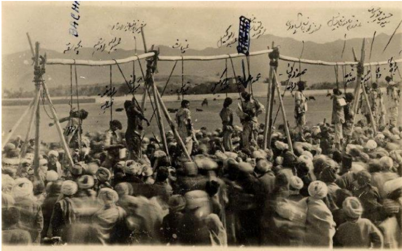
عکس اعدام دسته جمعی بچه سقو ویاران دزد او تبصره من بر عواقب اعمال سقویان