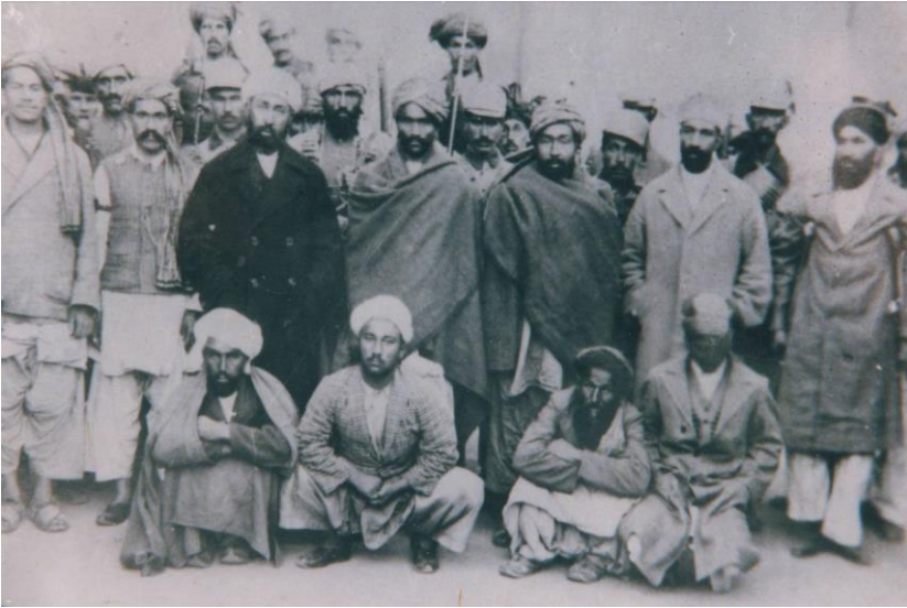
بانڈ دزدان سقوی قبل از اعدام در ۱۱ عقرب ۱۳۰۸