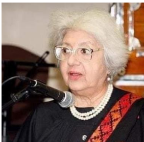
شاهدخت هندیه دافغانستان

شاهدخت هندیه نهمین فرزند شاه امان الله و ملکه ثریاست و نه ماهه در شکم مادر بود که با پدر و مادر و وابستگانش مجبور شدند افغانستان را ترک بگویند. به سخن دیگر شاه امان الله غازی و ملکه ثریا با خانواده شان در ۲۳ می ۱۹۲۹ کشور را ترک گفتند و از راه چمن وارد هند برتانوی شدند و توسط یک قطار راهی بمبئی گردیدند .