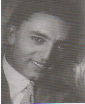
شیون در ۲۸ سالگی

کاتب تا غوربند رهبری کرد، اما با اطلاع از بیرون رفتن شاه امان الله، از راه طی کرده برگشت و مجدداً به تاشکند رفت و در عهدنادرشاه دوباره بوطن برگشت .