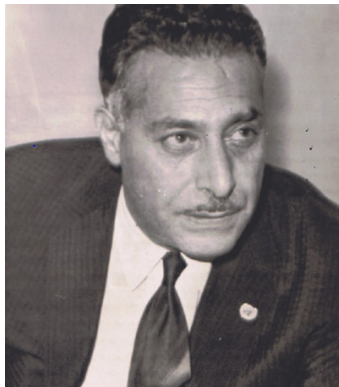
عبدالرحمن پژواک در سال ۱۹۶۷

وقتی نام پژواک بزرگ بر زبان آورده میشود، در ذهن من سیستانی، سیمای یک شخصیت ایده آل، یک دانشمند برآزنده، یک ادیب و شاعر ریالیست، یک دیپلمات آگاه و با وقار، یک انسان صادق و شجاع، یک متفکر سرشار از حب وطن و مردم دوستی، و یک افغان عاری از ریا و دروغ و خود خواهی مجسم میشود.