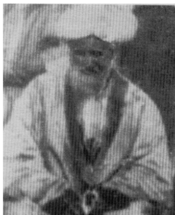
ملا صاحب چکنور

آخذ زاده امیر محمد معروف به ملا صاحب چکنور یک شخصیت معروف روحانی ایست که نه تنها از طریق منبر باموعظه ها و اندرز هایش به اصلاحات اجتماعی میپرداخت، بلکه همیشه عملاً در صف اول سنگر های نبرد آزادی کشور نیز قرار داشت. ملا صاحب چکنور فرزند اختر محمد از قوم مهمند بود که در قریه چکنور مهمند دره سکونت داشت و همیشه به جای امضایش "فقیر چکنور" مینوشت. سال تولد ملا صاحب چکنور ۱۲۲۲ یا ۱۲۲۳ هجری شمسی (۱۸۴۴ میلادی) تخمین شده است. چون ملا صاحب چکنور در کودکی پدرش را از دست داده بود، لذا مادر گرامی اش او را به عالمان و فاضلان دانشمندیون سپرد تا علوم متداوله را بیاموزد. ملا صاحب بعد از آن برای کسب تحصیل علم به بخش های مختلف نیم قاره هند مسافرت نمود. (۳)