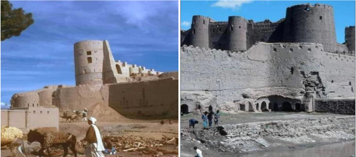
دو تصویر از قلعه گرشک در ساحل راست هلمند

تاریخ اعمار این قلعه را به سردار کهندهلخان خان برادر امیر دوست محمدخان حکمران قندهار (از ۱۸۱۸-۱۸۵۵) نسبت می‌دهند درحالی که شواهد حاکی وکتبی نشان می‌دهد که تاریخ اعمار آن خیلی پیشتر از عهد سردار کهندهل است و ممکن است سردار کهندهلخان دیوارهای آن را دوباره ساخته باشد و ملحقاتی بر آن افزوده باشد. در متون کلاسیک جغرافیایی مربوط به فتوحات اولیه مسلمین در این ناحیه بعد از بست و قبل از رسیدن به زمین داور از محلی بنام «تل» یا «ورتل» ذکر شده است که بگمان نزدیک به یقین همین گرشک بوده است. بنابر توصیف مقدسی جغرافیه دان شامی در قرن چهارم هجری، تل شهری بزرگ و صاحب قلعه‌ی بی بود که یک بلوک سوار از آن نگهداری می‌کرد. (احسن التقاسیم، ص ۲۹۷-۳۲۸) زیرا این قلعه در قرن دهم به منزله یکی از استحکامات سرحدی بود که مقابل کوهستان غور، و در ساحل راست رودخانه هیرمند، در یک منزلی بست قرار داشت.