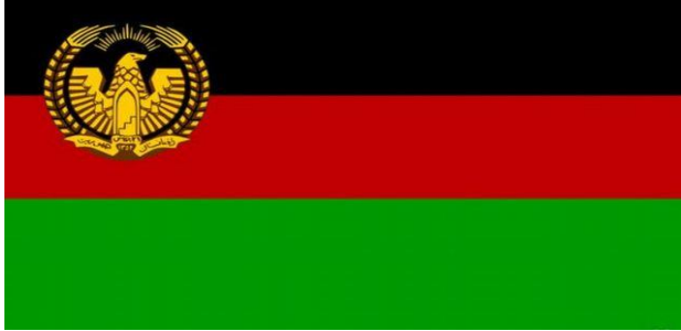
(د سردار محمد داؤد خان د جمهوري دولت ملي او اسلامي بیرغ)

افغانستان ملي بیرغ په سور رنگ بدل کړ خو ډېر ژر [ملي] بیرغ پورته کړ. (بي بي سي، فارسي) له سقاؤ وروسته د نادر شاه په واکمنۍ کې هماغه پخوانی درې رنگه ملي بیرغ پورته شو خو نښان ته یې بدلون ورکړی شو، د الله تعالی او محمد (ص) مبارک نومونه یې ترې وایستل او جومات منارې، محراب منبر او دوه سپین بیرغونو یې په کې انځور کړل او د نادر شاه د زوی ظاهر شاه د واکمنۍ تر پایه (۱۳۵۲ ل.) پورې بدلون په کې رانه وستل شو او په اساسي قانون کې هم ځای ورکړی شو.