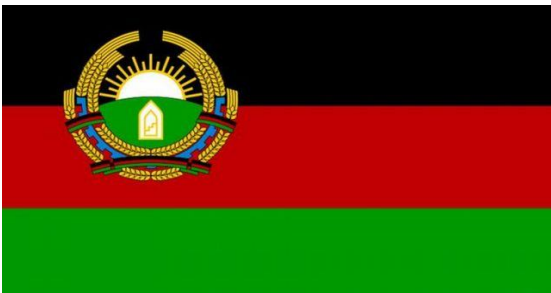
(د بیرک کارمل او ډاکټر نجیب حکومتونو ملي اسلامي بیرغ)

د ۱۳۵۷ ل، کال د غوايي له کودتا وروسته د خلق ډیموکراتیک ګوند خپل ځانګړی سور بیرغ چې د بیرغ نښان د نوموړي ګوند نښان ؤ او د غنمو د وړو په منځ کې د (خلق) کلمه چې په سر کې یې د ستوري علامه درلوده پورته کړ. په ۱۳۵۸ ل، کال کې چې کله بیرک کارمل د شورویانو د یرغل په ترڅ کې واک ترلاسه کړ، د سقاؤ زوی په څېر یې ملي درې رنگه بیرغ بیا پورته کړ او هغه یې