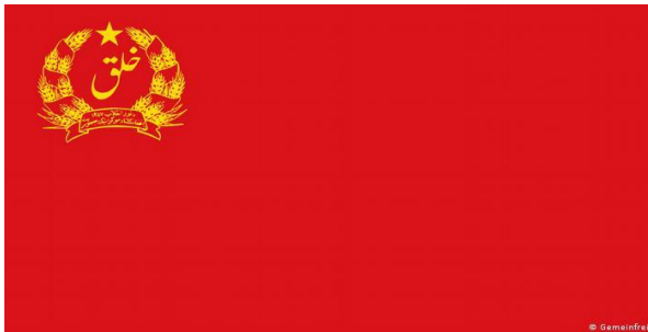
(د خلق ډیموکراتیک ګوند، ګوندي بیرغ)

د سردار محمد داؤد خان له کودتا سره سم (۱۳۵۲ ل، چنگاښ) د ملي بیرغ رنگونو ته تغیر ورته کړی شو، یوازي هغه درې رنگه چې په لنډو وو، په اوږدو وکارول شول او د بیرغ په نښان، د عقاب په منځ کې محراب او منبر د اسلامي نښې په توګه پرېښودل شوي.