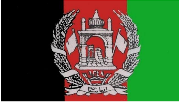
(د نادر شاه او ظاهر شاه د حکومتونو ملي او اسلامي بیرغ)

افغانستان ملي بیرغ په سور رنگ بدل کړ خو ډېر ژر [ملي] بیرغ پورته کړ. (بي بي سي، فارسي) له سقاؤ وروسته د نادر شاه په واکمنۍ کې هماغه پخوانی درې رنگه ملي بیرغ پورته شو خو نښان ته یې بدلون ورکړی شو، د الله تعالی او محمد (ص) مبارک نومونه یې ترې وایستل او جومات منارې، محراب منبر او دوه سپین بیرغونو یې په کې انځور کړل او د نادر شاه د زوی ظاهر شاه د واکمنۍ تر پایه (۱۳۵۲ ل.) پورې بدلون په کې رانه وستل شو او په اساسي قانون کې هم ځای ورکړی شو.