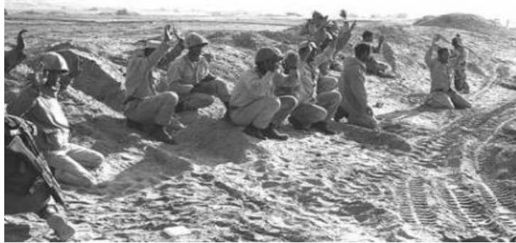
عساکر تسلیم شده عرب در جریان جنگ شش روزه در سال 1967 1

یکی از مهمترین وقایع جنگ شش روزه نقش اتحاد شوروی بود که به صراحت اعلام کرده بود که مستقیماً به دفاع از ممالک عربی داخل جنگ خواهد شد اما در میدان عمل عرب ها را تنها گذاشت. امر یوسف در صفحه 9 تحقیق خود از زبان وزیر دفاع آن وقت شوروی مارشال گریچکو نقل کرده است که قبل از شروع جنگ به مقامات مصری گفته بود "اگر امریکائی ها داخل جنگ شوند ما به طرفداری شما داخل جنگ می شویم... من می خواهم که تاکید کنم که اگر واقعه ای شد و شما به ما احتیاج داشته باشید ما فوراً به دفاع شما از راه بندر پورت سعید داخل جنگ خواهیم شد." 2 اما شوروی ها داخل جنگ نشدند و امروز بعد از از بین رفتن اتحاد شوروی و گذشت سال های زیاد اسناد زیادی بدست آمده است که نشان میدهد شوروی ها در جنگ شش روزه قصداً نقشی بازی کردند که ممالک عربی زیاده تر وابسته به آنها شوند. " یک تعداد محققین معتقد هستند که مسکو مسبب جنگ شش روزه بود تا بدینوسیله وابستگی ممالک عرب را به کمک های شوروی افزایش بدهد و از طرف دیگر قوت های مترقی را زیاده تر متحد ساخته و بدینوسیله موقعیت خود را در شرق میانه مستحکم بسازد. " 3 در چنین شرایط حساس جنگ سرد صدر اعظم افغانستان بیطرف محمد هاشم میوندوال در همین سال 1967 برای یک سفر رسمی به امریکا رفت و مورد استقبال گرم دولت امریکا قرار گرفت.