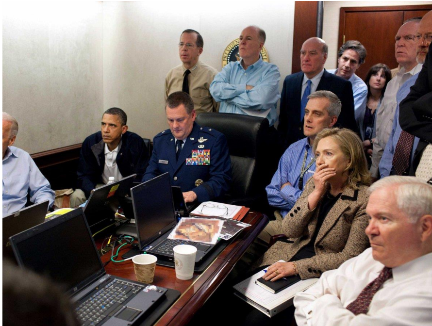
رئیس جمهور اوباما و اعضای کابینه امنیت ملی وی در حال مشاهده عملیات حمله بر بن لادن

دلورانہ رئیس جمهور اوباما توصیف کرد 4 . عکس های پریشان اوباما و کابینه ای وی که حمله را توسط ویدیو کمره و ستلایت لحظه به لحظه مشاهده میکردند به صورت وسیع در مطبوعات دنیا منتشر شد.