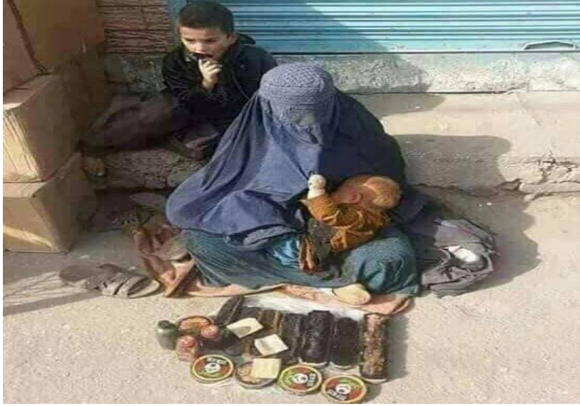
په راتلونکې کې پر دې ماشوم هیڅ څوک حق نه لري، حتی وطن هم!