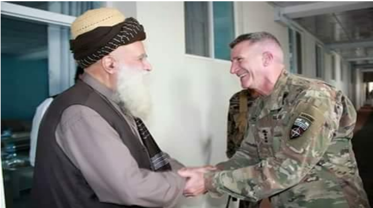
هر څوک چې کافر ته لاس ورکړي، لاس يې د غوڅولو دی! (د سياف عليه رحمه؟ له ارشاداتو څخه)