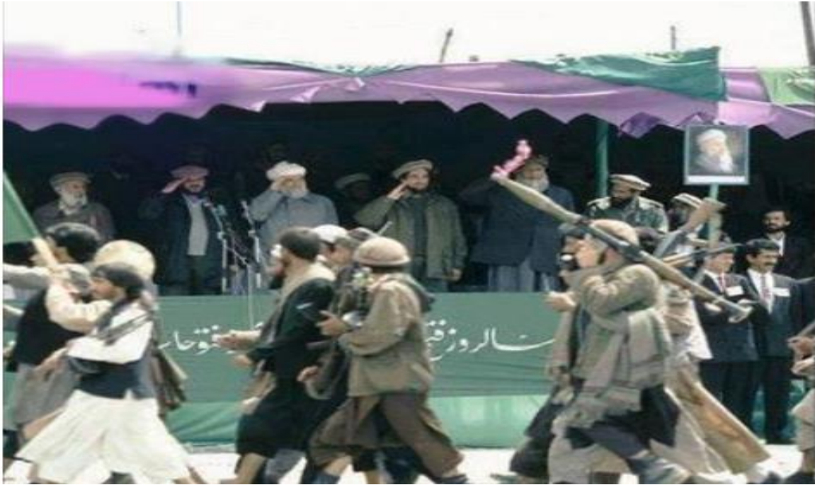
د نړۍ تر ټولو منظم پوځ؟