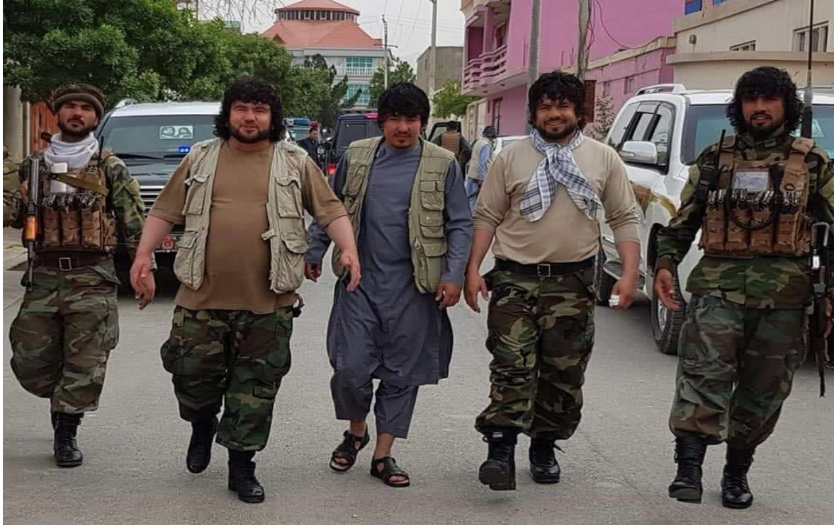
ما جهاد؟ کډيم، ما مقاومت؟ کډيم، هر چه که کنيم حق ماست!