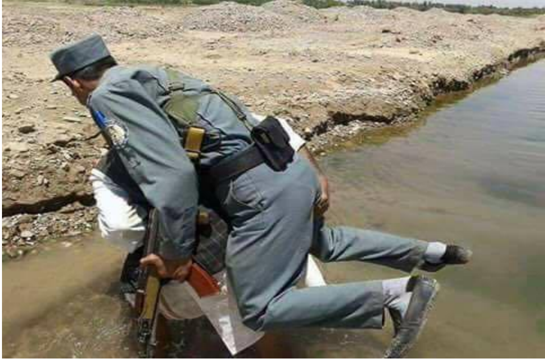
پوليس د ټولني خدمتگار؟