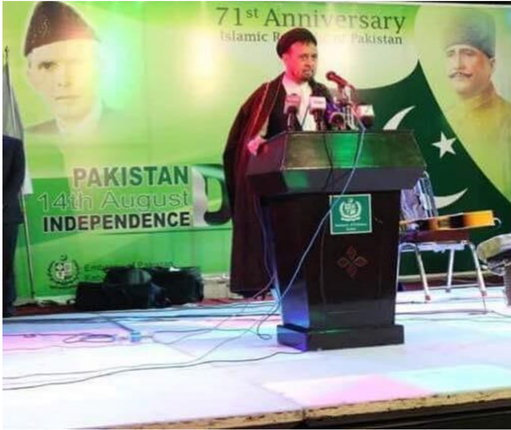
محقق دي چوده (۱۴) اگست لمانځي، په همدې ورځ د چوده اگست لمسيانو غزني په وینو کي ولامباوه.