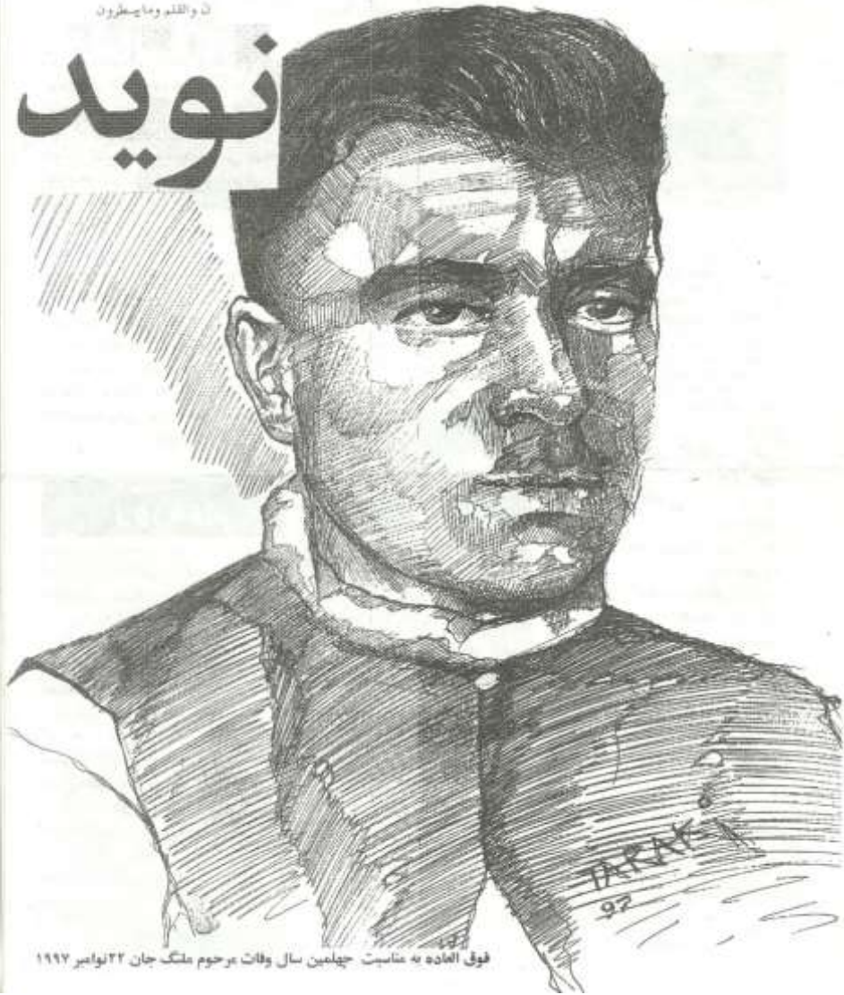
فوق العاده به عنايت جيلمين سال وفات مرحوم ملنگ جان 22 نوامبر 1997

لکه د چا خبره «هی میدان و طی میدان و خار مُغیلان» لکه زورور باد چې وچې پاني په هوا کړي، زه هم یو زورور باد په هوا کړم او د باد په آرامیدو سره مې چې پام شو، د ډنمارک په نامه په یو ځای کې لویدلی وم.