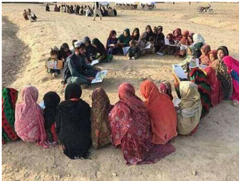
د څلورمې برخې پای