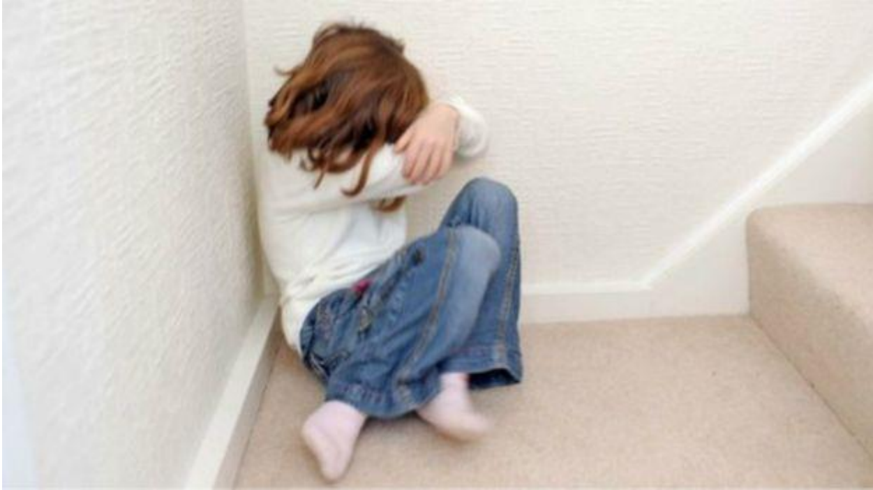
د دولسمې برخې پای

د عدم تشدد پالیسی په خپلولو او پیروی سره تر ډېره د رنګارنګ تاوتریخوالي مخه نیول کېدای شي. له ژبني تاوتریخوالي نه نیولي بیا تر وهلو ټکولو، جنسي تاوتریخوالي، په زوره کار او جګړو ته اړ ایستل، په جبر سره خپله عقیده په چا باندې منل او... پورې.