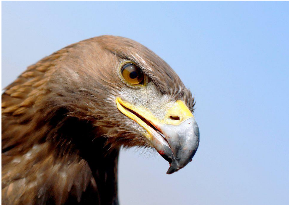
انځور له بي بي سي پښتو څخه