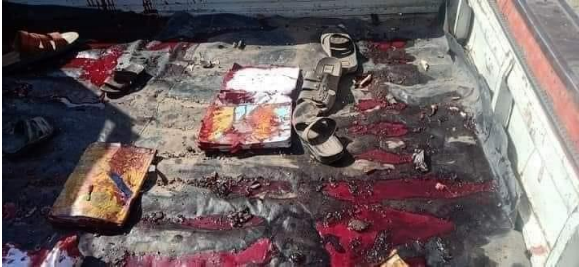
دا د شینوارو د ماشومانو د څو لیټرو وینو ناچیزه ډالی ده چې په حورو پسې تلونکي په لاره کې تړي نه شي.

دلته د ننگرهار د غني خیلو د پېښې دا دوه عکسونه ږدم او ورسره هغه جملې چې د عکسونو د لیدلو په شیبه کې زما د ذهن په گومیزه کې گرځېدې راگرځېدې: