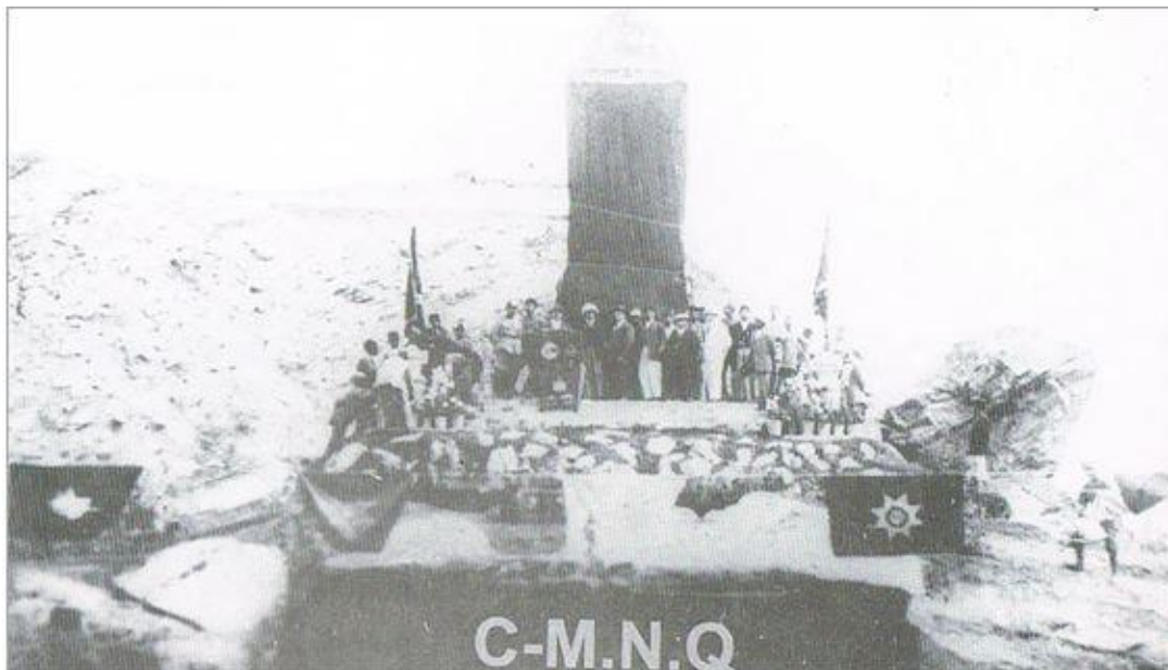
[۲] روز افتتاح منار علم و جهل

این یادگار با سعادت و افتخار بتایخ ۲۳ جوزا ۱۳۰۴ ش تأسیس یافت، تا فرزندان آینده کشور، وطن دوستی و معارف خواهی های آن فداکاران راه حقانیت را به نظر تمجید و بازماندگان شان را به نگاه احترام دیده، افراد حساس و احفاد حق پرست افغان را دلیل رفتار و سرلوحه افتخار باشد. اسمای شهدای راه علم و ترقیات افغانستان بدین قرار است: