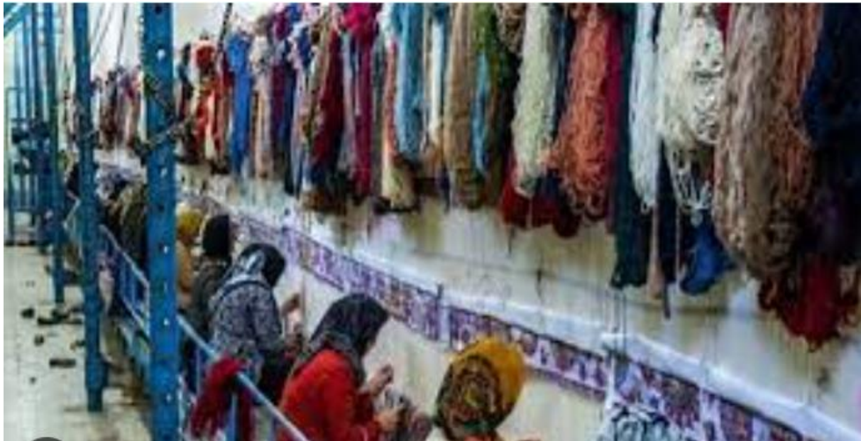
دستگاه قالین بافی

به این ترتیب طی سه سال متذکره صادرات قالین و گلیم به اندازه ۲.۹۳ میلیون متر مربع به ارزش ۷۵.۸۳ میلیون دالر صورت گرفته است که امیدوار کننده به نظر میرسد.