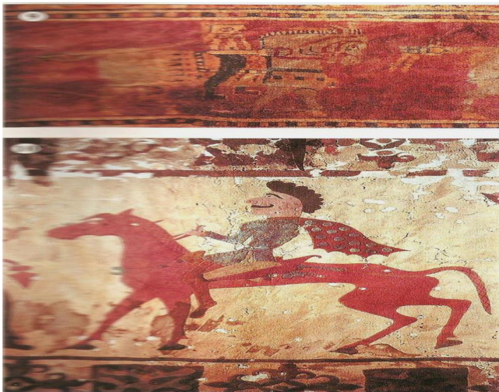
فرش قالین که در سایبیریا از زیر یخها بدست آمده و حدود ۱۵۰-۲۰۰ سال قدمت دارد