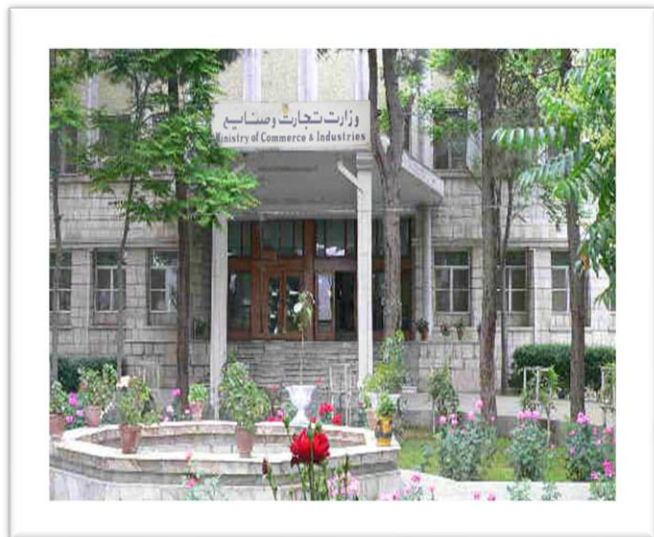
تعمیر فعلی وزارت تجارت و صنایع

مالیه و ظایف محوله را انجام میدادند. بنابراین وزارت تجارت، تشکیل وسیع نداشت چنانچه در سال ۱۳۵۵ وزارت تجارت دارای ریاست های تجارت خارجی، انکشاف صادرات، تجارت داخلی و ریاست بین المللی ترانزیت بود.