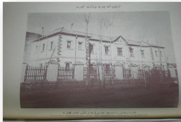
یکی از تعمیرات وزارت تجارت در سال ۱۳۱۳ در کنار دریای کابل

با تحکیم نظام و ایجابات عصر، دوایر دیگر از قبیل ریاست تنویر، مدیریت عمومی فابریکات، مدیریت جاده غوربند و سایر جاده ها، مدیریت حمل و نقل، مدیریت سرده غزنی، ماموریت ذغال فرح، ماموریت نرخ موترها یکی پی دیگری درچوکات آن تاسیس شد و در سال ۱۳۱۶ نظر به انکشاف امور اقتصادی مدیریت های عمومی بریاست ارتقاء داده شد.