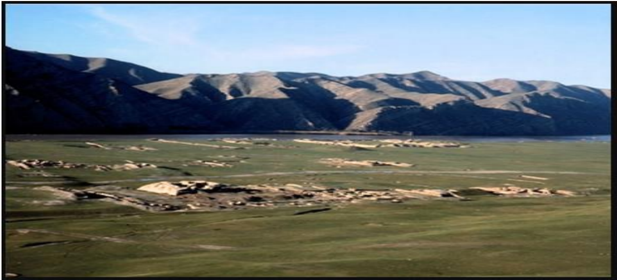
طبیعت زیبای آی خانم