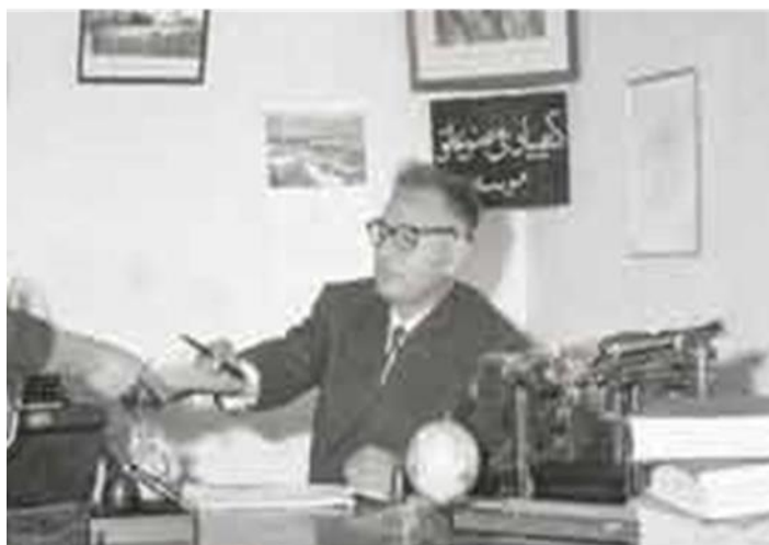
دفتر موسسه کیمیای یوسفی جوزای ۱۳۴۰ ش