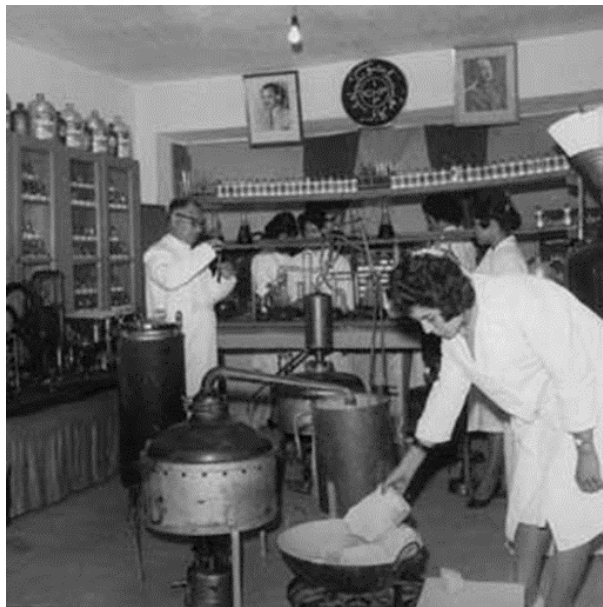
لابراتوار موسسه کیمیاوی سال (۱۳۴۳ ش ۱۹۶۴ م)