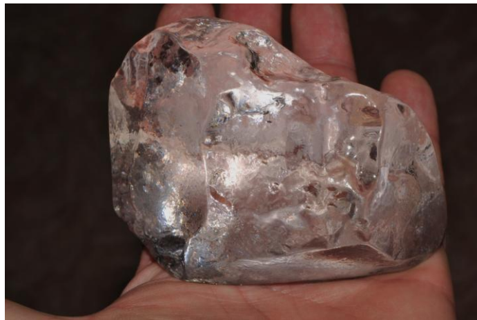
دویم عکس: کولینان الماس په طبیعی بڼه کی

دېده مرغه د کولینان دا ستر او ارزښتناک الماس په بشپړ ډول مونولیت (پکلخت) نه وو او په دننه کې یې یو شمیر ډیر واره درزونه درلودل چې دماهر و سترگو څخه پټیدلای نه شول. د دغی نیمگرتیا له مخی په یوه ستر غمی باندی د کولینان حکاکي کول تر سره کیدلای نه شوه. که دا نیمگرتیا نه او په یوه ټوټه سره حکاکي شوی وای، دا به دطبعیت او انسانی هنری لاسونو یو عجیب شهکار پاته وای. لکه څنگه چی وویل شوه ددی الماس دحکاکي کار څه اسانه خبره نه. اسکیر څو میاشتی پرله پسې هغه بڼه وڅیره او د کار ټولی چاری یې بڼه وسنجولی. وروسته یې د څو تنو وتلو د زرگری چارو ماهرانو په حضور کی د الماس د یوی سطحی پرمخ یو ډیر وړوکی زخم جوړ ، پر هغه یې اړونده اله (اسکنه) کښیښوده او د چوپیی چوپینیا په هیجانونکی فضا کی یې په چکش باندی پراسکنه واری وکړ. ددی سره سم دی پخپله د ډیر تشویش له مخی بیهوشنه شو او کوما ته ولاړ. کله چی په هوبن راغی ، ویی لیده چی صحیح حساب یی کری وو .