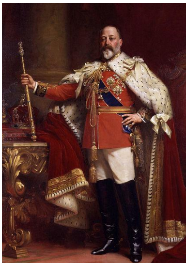
لومړی عکس: ادوارد اووم (Edward VII)

کولینان الماس د ۱۹۰۵ کال د جنوري په ۲۵ نیټه په تصادفي ډول د جنوبي افریكا د کولینان په کان کې تر لاسه شو. داسیمه د ۱۹۰۲ کال څخه د برتانیې مستعمره گرځیدلی وه او لاس پوڅو چارواکو یې د ۱۹۰۷ کال د نومبر په ۹ نیټه د برتانیې ټولواک ادوارد اووم ته دده د زیدني په ۶۶- تمه کالیزه کې د الماسو داستره ټوټه سوغات ورکړه. تر دی گړیه لا دا وتلی الماس په خپل طبیعي حالت کې وو چې له عادي ډبرې نه یې په ظاهري بڼه څه خاص توپیر ندرلود. د حکاکي او غمی کولو چاری یې ټولواک د « اشیر » پنامه یوی هالیډي کمپنی ته وسپارلی. الماس پدی موخه چې څنگه باید حکاکي شي، څو میاشتي په ډیر دقت سره د پیاوړو ماهرانو لخوا وڅیړل شو. په پای کې په ۱۹۰۸ کال په دوو غټو او څو وړو ټوټو ویشل شو. دوی ټوټې یې غټ مونولیت (یکلخت) بلاکونه وه، ۷ نوري ټوټې یې منځني غټ بریلیانت (غمیان) او ۹۶ دانې یې واره غمیان تری نه ترلاسه شوه. یوه غټه ټوټه یې هغه مهال بیله حکاکي څخه پرېښودل شوه. د الماس بیه تر اوه نیم میلیون ډالرو پوری ارزول شويده.