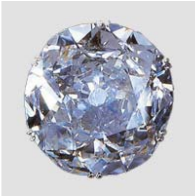
کوه نور بریلانت اوسنی شکل

د الماسو داغمی چی دنړی دتر ټولو سترو ټوټو دسر په ډله راخی چی اوسنی وزن یی ۱۰۸،۹۳ قراطه (نژدی ۲۲،۸ گرامه ) دی او سپین رنگ لری . دپیدا کولو نیټه او دموندونکی نوم ئی تر اوسه معلوم ندی ، خوداخبره څرگنده ده چی حیدر اباد ته نژدی دهندوستان داندراپردیش ایالت په گلکنده نومی سیمي کی تر لاسه سوی دی . داڅکه چی تر ۱۷۳۰ زیږد کال دمخه چی په برازیل کی دالماسویو معدن وموندل شو ، د گلکندی دمعدن نه پرته په ټولی نړی کی بل دالماسو معدن نه وو . له همدی کبله د کوه نور دزیږدنې ځای بیله تردید نه گلکنده گڼل کیږی . ددی خبری سره سره داسی هم ویل شوی دی چی دا الماس د میلاد نه ۳۲۰۰ کاله وړاندی دیوه رود د بسنر نه پلاس راغلی دی .