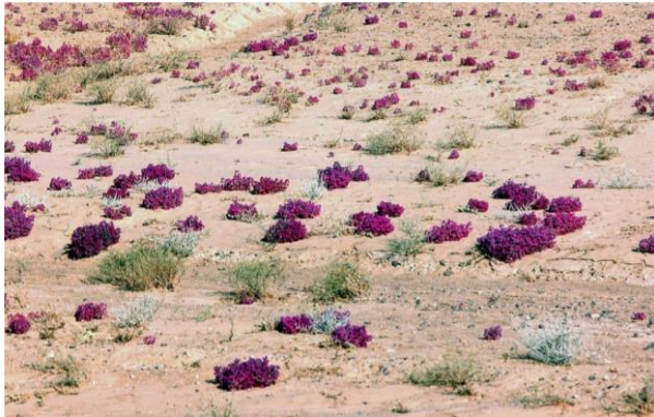
گیاهان با گلهای Amaranthaceae Halarchon Versicolosum : گیاهان با گلهای بنفش. دشت مارگو در شمالغرب قندهار.

منابع و مأخذ رسالات، کتابها و عکسها و در فصل ۱۰ فهرست مقولات مسلکی (لغتنامه) ارائه گردیده اند. فهرست تقسیمات گیاهان در فصل ۱۱ صورت گرفته. در پایان مؤلفان این کتاب در فصل ۱۲ معرفی شده اند. در این اثر کلید شناسائی برای تمامی گونه های خزه ها که تا اکنون در افغانستان شناسائی شده اند (۲۴ لیپورت، ۲۴۵ خزه و یک هارن ورت) ارائه گردیده. در جوار خزه های Pottiaceae (۶۵ تکسا)، بریوفایت های مناطق کوهستانی و ارتفاعات بلند و Bryaceae (۳۰ تکسا) و Grimmiaceae یا صخره زیها (۲۲ تکسا) گروههای مهم را تشکیل می دهند که مفصلاً شرح داده شده اند. در رابطه با چک لیست جامع بریوفایت ها در ذیل چند نمونه از کتاب "رهنمای لیپورتها و خزه های افغانستان" آورده می شود: