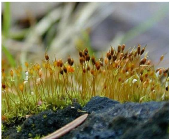
Weissia controversa : کنر، وامه، صخره های آبچکان در ارتفاع ۱۳۸۰ متر از سطح بحر. گسترش: کنر، کابل، کاپیسا و غیره جاها.