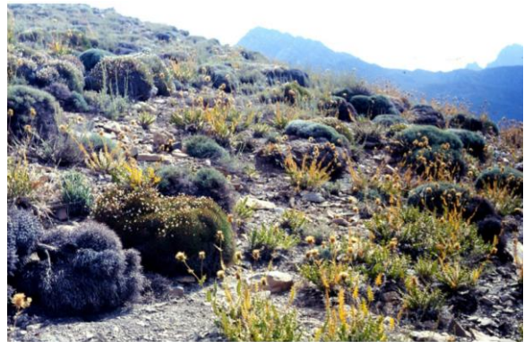
Cousinia و Acantholimon : جمعی از گیاهان خاربن، عمدتاً با ساحهٔ پیدایش خزه ها از فامیل Pottiaceae که با شرایط بسیار خشک توافق یافته اند. کوتل اشترگردن.