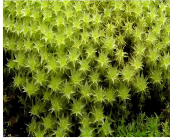
Dichodontium palustris : هرات: زیارت ملای خواجه کوه در ۲۰ تا ۳۰ کیلومتری شمالغرب هرات (تصویر: (S.-W. Breckle).