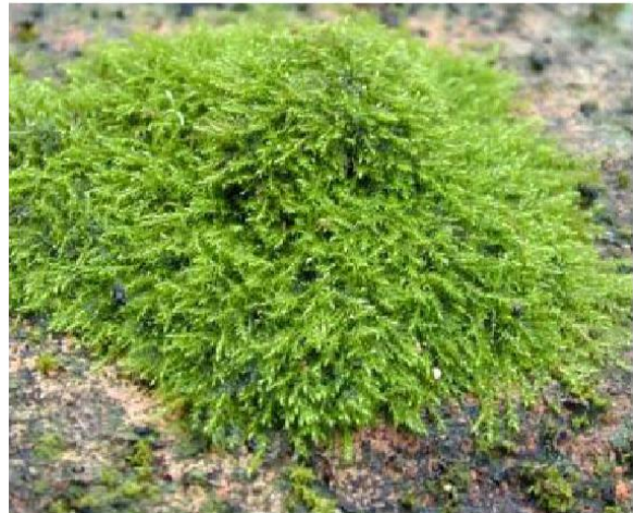
Amblystegium serpens : بند امیر در ارتفاع ۱۸۰۰ متر از سطح بحر.