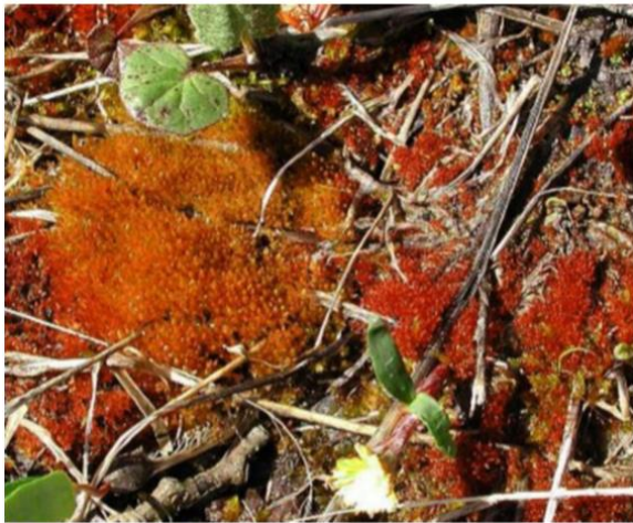
Bryum turbinatum : بغلان: کوتل سالنگ، حدود ۲ کیلو متری شمال تونل در ارتفاع ۳۰۰۰ متر از سطح بحر.