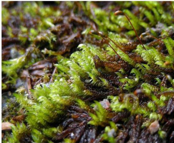
Hygrohypnum luridum : بدخشان: در ه یوخام در ارتفاع ۳۰۰۰ متر از سطح بحر.