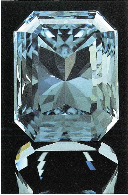
تصویر 4: اکوامرین پالتش شده.