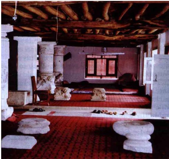
تصویر 6: پایه‌های یک قصر مرمرین عصر تمدن یونانی که در بلخ پیدا شده و توسط جنگسالاران تخریب، چپاول و در منزل شخصی بکار رفته.