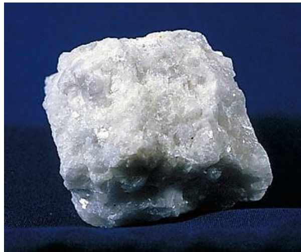
تصویر 1: نمونه ای از سنگ مرمر.

http://www.bing.com/images/search?q=Marmor&qvpt=Marmor&qvpt=Marmor&qvpt=Marmor&FORM=IGRE