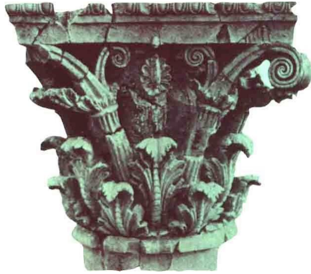
تصویر 5: پایه‌های مرمرین قصر "آی خانم" از عصر تمدن یونانی در افغانستان که توسط جنگسالاران با سائر آثار تاریخی این ساحه چپاول شد.