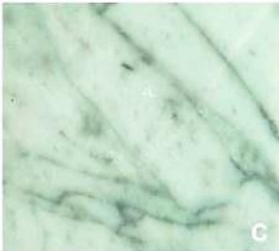
تصویر 2: نمونه ای از سنگ مرمر پالش شده افغانستان.

مرمرها در ساختمانها قدیم و جدید به کثرت مورد استفاده قرار گرفته و ارزش فرهنگی پیدا کرده اند، چنانکه شاهکاریهای فرهنگی و هنری از مرمرها ساخته شده اند (تصاویر 1 تا 6). مرمرها نه تنها در هیکل تراشی و عمارات، بلکه در فرشهای اطاقها، زینه ها، روی دیوارهای ساختمانها، حوضها و غیره نیز بکار میروند. استخراج سنگهای مرمر که از هزاران سال قبل آغاز گردیده، کار بسیار پر مشقت است.