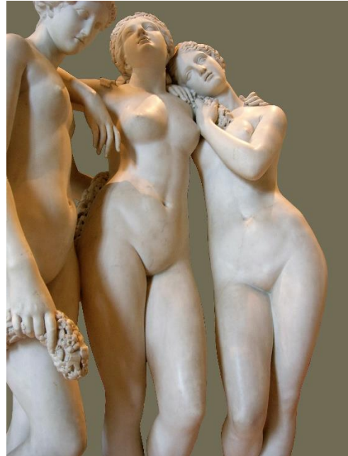
تصویر 3: هیكله‌های مرمرین که توسط پیکره تراش فرانسوی به نام Jean-Jacques Pradier ساخته شده و در موزیم Musée du Louvre, Paris حفاظت می‌شود. https://de.wikipedia.org/wiki/Marmor