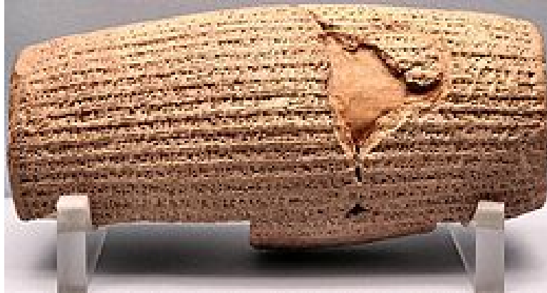
Der Kyros - Zylinder

خو د ډیرو ځانگیز او تاریخ پوهانو په اند د بشر د طبیعي او مدني رښتو د احترام او ساتنې په باب، تر ټولو لرغونی لاسوند، له زیږدیز څخه ۵۳۹ کاله مخکې په یو استوانی خاورین لوبنی، چي د کوروش Kyros د ستر منشور Cyrus human right cylinder په نامه یادېږي، لیکل شوی دی: