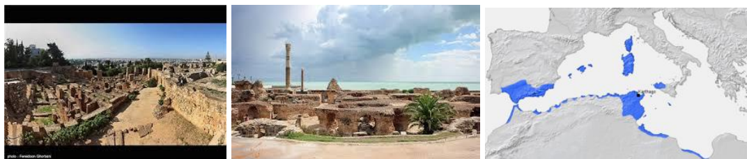
نقشه راست: محل کارتاز و حوزه نفوذ کارتازان حدود 264 سال قبل از میلاد. وسط و چپ: شهر باستان کارتاز

قرطاج یا کارتاز (یونانی: گرفته شده از واژه فنیقی "قرت حدشت" به معنای شهر نو) نام مستعمره یک قبیله فنیقی بود، که از نظر جغرافیایی در تونس کنونی واقع شده بود، قبل از ظهور روم بر غرب مدیترانه حکومت می‌کرد و یگانه قدرت دریایی منطقه بود. این قدرت در سده‌های سوم و دوم پیش از میلاد با جمهوری روم در کشاکش بر سر چیرگی بر مدیترانه غربی بود. رومی‌ها کارتازها را Poeni (پونی‌ها) می‌نامیدند.