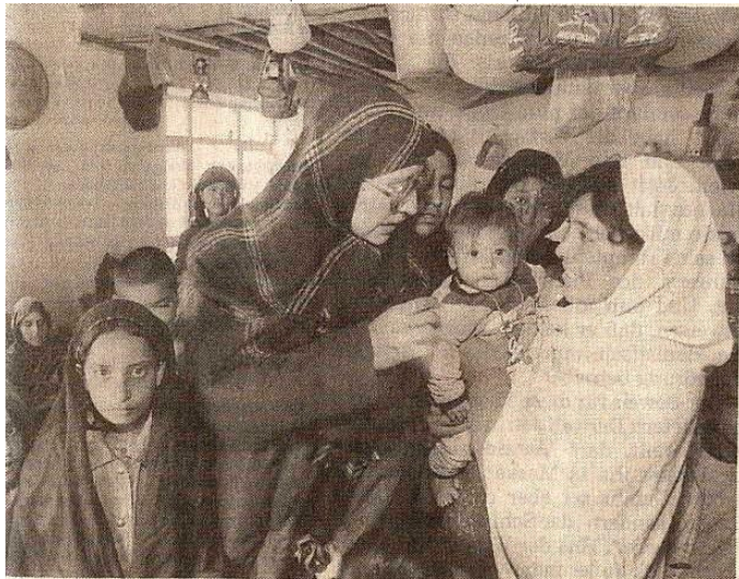
VIEL schlechter dran als die Menschen in Bosnien: Die afghanische uis Katil versorgt mit Unicef-Mitteln kranke Kinder in Kabul.

در جنگ «داخلی»، یعنی «جنگ بر سر قدرت» بین «تنظیم های جهادی» و «جنگ سالاران»، در محدوده شهر پایتخت، «ژورنالیست خارجی» می نویسد که: «در وسط، یعنی در خط جنگ، سه شفاخانه بشمول «شفاخانه ۴۰۰-بستر» واقع می باشد.» خبر نگار این «جنگی های عقیده» را به عدم توجه به انسان متهم ساخته، تذکر می دهد، که در یک روز «هفت اصابت» به شفاخانه چهار صد بستر گزارش گردیده، نا ممکن است که همه فیر ها را بمثابه «خبط» پذیرفت. بدین معنی که حرف هدف گیری عمدی نیز در میان بوده است.