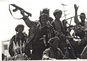
Taliban-Krieger, Buddha in Bamian (1997): „Götzenvernichtung“

آغاز سال ۲۰۰۱م، بری افغانستان و محافل فرهنگدوست جهان، به ارتباط با حوادثی که در افغانستان جریان داشته است، خیلی نگران کننده بوده است. درین سال علاوه بر اختلافات مجامع بین المللی با موضعگیری رهبری طالبان، رهبری افراطی «طالبان»، و شخص ملامحمد عمر موضوع انفجار مجسمه های «بودا» در بامیان را در پیش گرفت، باوجود تلاشهای وسیع بین المللی. این اقدام طالبان، نفرت و نگرانی رانسبت به حکومت آن، بیشتر ساخت. بروز وقایع در کشور جنگ زده ما جهان را تکان داده است، ولی از فضای خبری، چنین بر می آید، که برای حلقهات در گیردر جنگ افغانستان، حیات مردم و دستاورد های فرهنگی مطرحنبوده است.