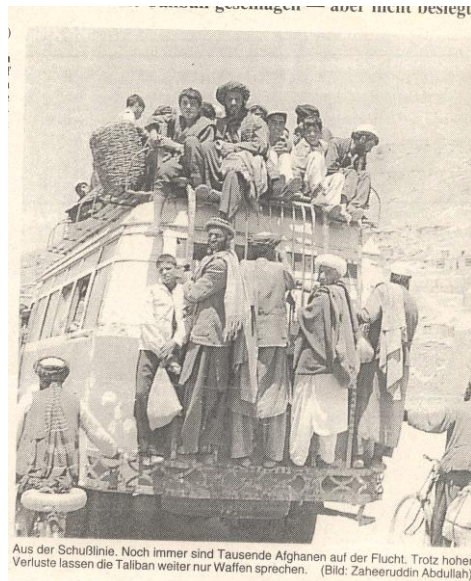
Aus der Schulinie. Noch immer sind Tausende Afghanen auf der Flucht. Trotz hoher Verluste lassen die Taliban weiter nur Waffen sprechen.

روزنامه «فرانکفورتر روندشاو»، در شماره روز ۲۰ جون ۱۹۹۷، تحت عنوان: «دو چهره عبدالملک» می نویسد که «مرد قوی نو افغانستان طالبان را ضربه زد - اما بر آنها پیروز نشد.» در همین شماره ضمن نشر تفصیل خبر، اوضاع را بانشر این عکس، روشن می سازد، که انسانهای ملکی، با چه وسیله تلاش می ورزند، تا خود را از دم مرمی نجات دهند.