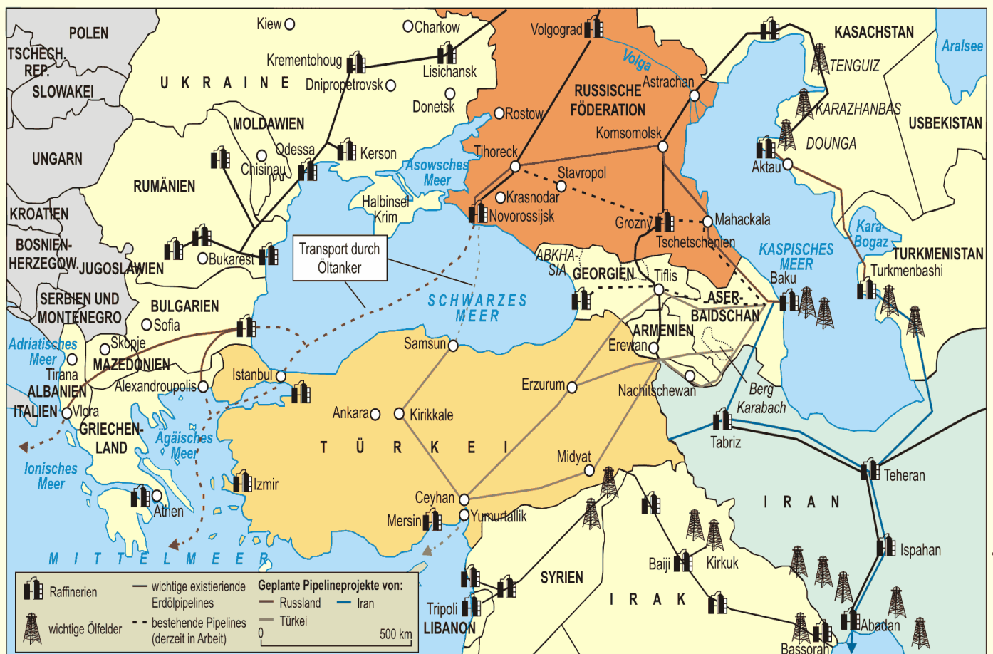
Abb. 1 Wesentliche Routen für Erdöl und Erdgas aus dem Kaspischen Raum

منځني برخه نه يوازې د تيلو او گازو د شتمنو هيوادونو لکه ايران، عراق، سعودي عربستان، کويت... او د کسپين د سمندرگي شأ و خوا سيمو د درلودلو، بلکې په هغې کې د افغانستان او د قفقاز د سيمې د ستراتيژيک پريوت له امله هم د پام وړ ده. قفقاز، چې د تور او کسپين سمندرگيو ترمنځ پروت دئ او د اسيا او اروپا وچه سره نښلوي، يوه مهمه ستراتيژيکه سيمه ده. له همدې امله دا سيمه د امريکايانو له پاره سياسي او اقتصادي ارزښت لري، چې ښه بيلگه يې د باکو-تفليس-جیحان BTC د تيلو او گازو د نل ليک جوړول دي. دغه پروژه، د ۳،۶ ميليارديو ډالرو په ارزښت جوړه او د تير کال د می په مياشت کې د امريکا د متحدو ايالتونو د انرژي د وزير له خوا پرانيستل شوه (وگوري: Spiegel Special, 2006, S. 11). پر سيمې باندې د اغيز موخه د انرژي په برخه کې د متحدو ايالتونو د گټو سمبالښت او د تيلو او گاز د نل ليکو کنترول (وگوري لومړۍ نقشه)، لومړۍ نقشه: د منځني اسيا د تيلو زيرمي او د هغوي د ليردولو لارې