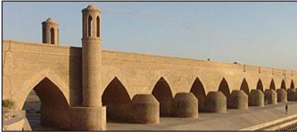
پل مالان در هرات

پل مالان ، یکی از پلهای مستحکم و تاریخی هرات است که بر روی رودخانه هریرود در منطقه مالان ساخته شده است. این پل در مسیر جاده قدیمی هرات - قندهار واقع شده و در گذشته های دور، کاروان هایی که از هرات به مقصد سیستان، قندهار و هند سفر می کردند، از این پل عبور می نمودند. این پل در سال ۵۰۵ هجری قمری (برابر با ۱۱۱۰ میلادی) و در زمان سلطان سنجر سلجوقی به همین شکلی که اکنون دیده میشود، با اندک تفاوت، ساخته شد. (بی بی سی ۲۰ جون ۲۰۰۸)