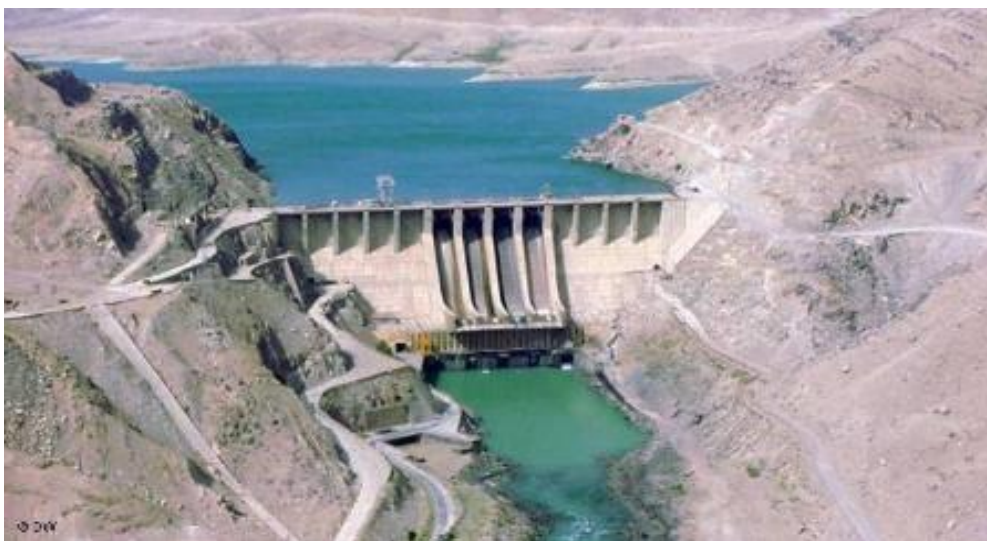
بند سلما در هرات

بند سلما در ولایت هرات به عنوان بزرگترین پروژه زیر بنایی افغانستان در دوره ریاست جمهوری داود خان طرح ریزی شد و کشور هندوستان متعهد به ساختن آن شده بود و ۲۵٪ کارش پیش رفته بود که کودتای ثور ۵۷ رخ داد، و کار اعمار بند از سوی مخالفان رژیم اخلاص شد ولی متوقف نگردید و تا سال ۱۳۶۱ش ادامه یافت.