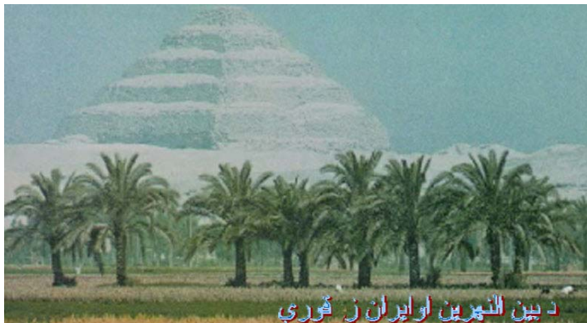
د بین النهرین او ایران ز قوری آثار بجای مانده در آسیای جنوب شرقی از جمله ای معبد وصل نا شدنی [ آنکور ]