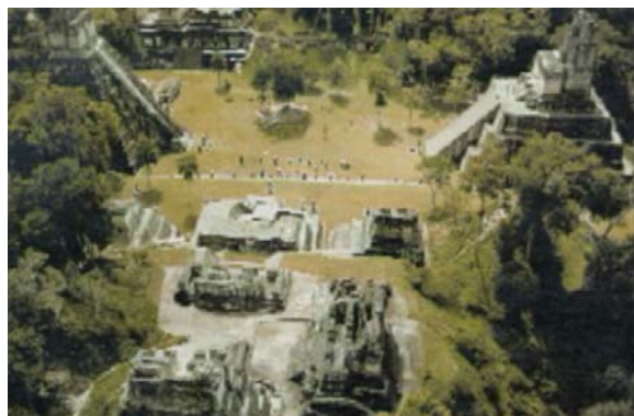
عبادتگاه ها و مجسمه های فراوان و شکوهمند بودا در هند