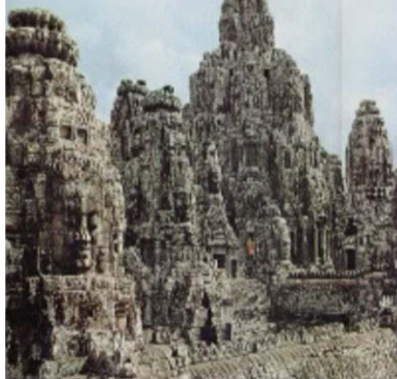
معابدی با ابعاد غیر قابل تصور در اندونیزی