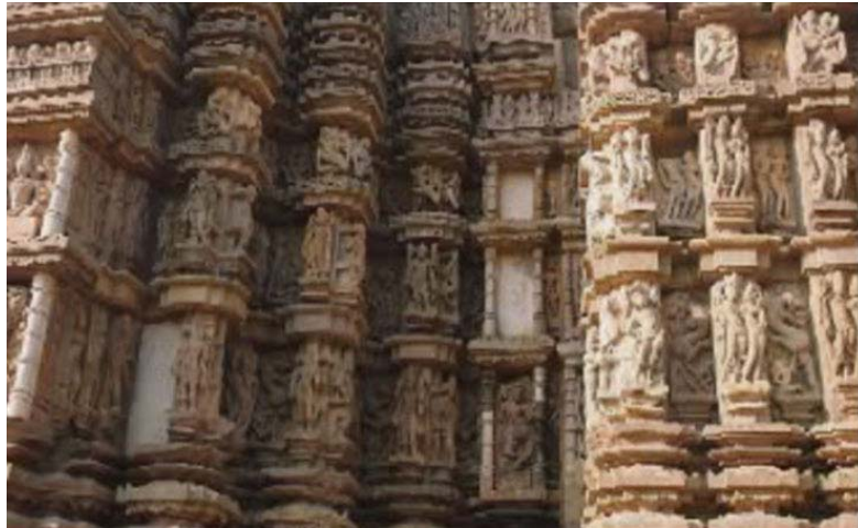
آثار بجای مانده از تمدن [سوروکی] در بین النهرین