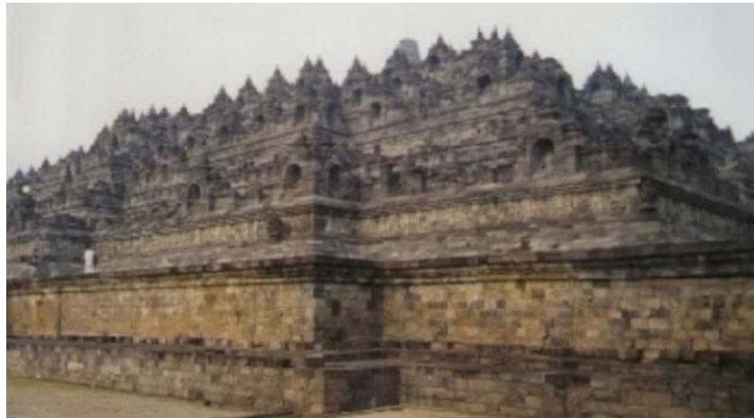
سجده گاه های پلکانی و پیر اسرا بجای مانده از تجمع اقوام [ مایا ] در آمریکای مرکزی