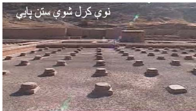
نوي کرل شوي ستن پایي

د پانوی شمیره: له ۵ تر ۹ افغان جرمن آنلاین په درنښت تاسو همکارۍ ته راوبولي. په دغه پته له مور سره اړیکه ټینګه کړئ maqalat@afghan-german.de د لیکنې د لیکنیزې بڼې پازوالي د لیکوال په غاړه ده ، هیله من یو خپله لیکنه له رالیرلو مخکې په خبر و لولئ