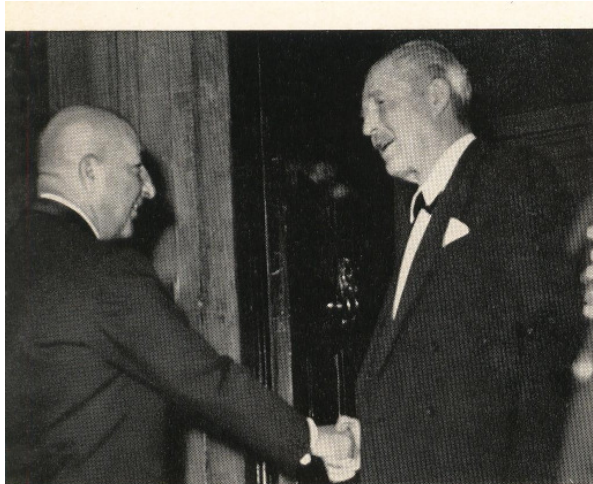
Der afghanische Ministerpräsident wird im Admiralty House vom britischen Ministerpräsidenten Macmillan begrüßt.

در این «پروگرام»، منظور از دیدار رسمی با ملکه «ایلیزابیت دوم» (Elizabeth II.) انگلستان و مذاکرات با «مک میلان» (Macmillan) صدراعظم انگلستان بوده است.