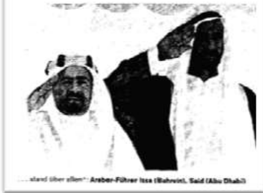
...stand über allem" Araber-Führer Issa (Mahvini), Said (Abu Dhabi)

ازینکه تغییر رژیم بدون "خونریزی" صورت گرفت، ممکن است، در آن لحظات در محافل بین المللی، بحیث یک حادثه "داخلی" و یا "تغییر در قصر" در نظر گرفته شده باشد. تحلیل عمیق از عوامل درینجا نمی گنجد، اما حقیقت آنست که افغانستان از انکشافات بین المللی مستقل و مجزا نبوده است. "روشنفکران" افغان هم، در تحت آن شرایط ملی و بین المللی، به جست و جو، راه حل مسایل حیاتی خود بوده اند.