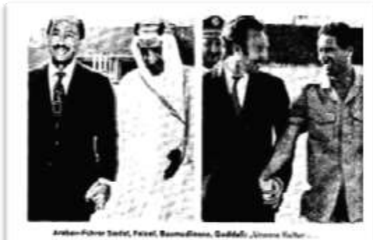
Araber-Führer Sedat, Fazel, Baumstark, Gadhafi, Ummu Kulthum...

از آغاز فضای جنگ سرد در عرصه بین المللی، الی سال ۱۹۷۳م، فقط ۲۶ سال می گذشت، که در افغانستان رژیم سلطنتی سقوط داده شد. در قسمت اول، درباره اوضاع افغانستان درین سال "بحرانی"، مجله "شپیگل" از موقف رژیم "کودتای سفید" در کشور ما و هم در باره حوادث این سال در سراسر جهان معلومات ارائه گردیده است، که حادثه افزا بوده است.