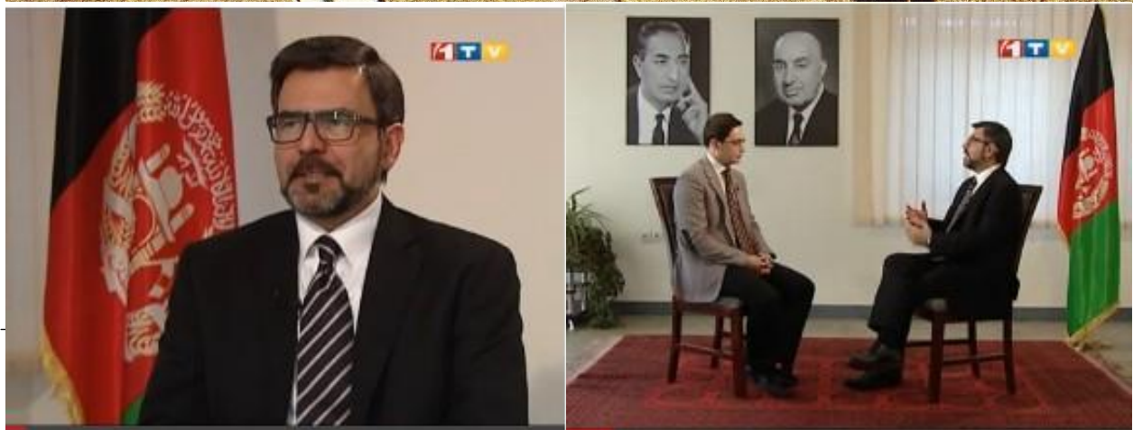
یادونه: دلیکنی د لیکنیزی بنی پازوالی د لیکوال په غاړه ده ، هیله من یو خپله لیکنه له رالیرلو مخکې په خیر و لولئ